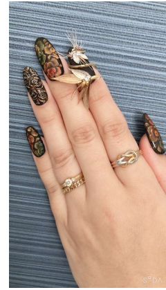
【3】ハンド（両手もしくは片手）